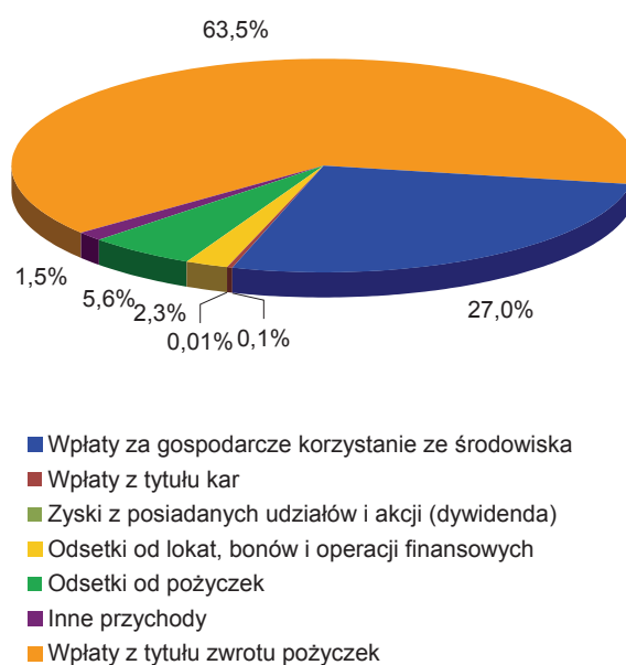
Ryc. 16.4.2. Struktura przychodów WFOŚiGW w Rzeszowie, w 2010 r. [45]