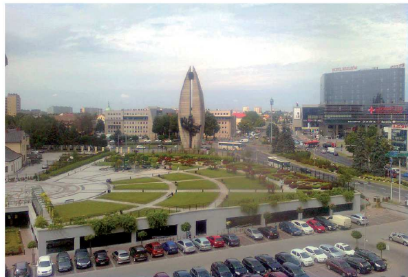
Rys. 1.1. Ogrody Bernardyńskie, Rzeszów 2014 r. (źródło: [38])

Województwo podkarpackie leży w południowo-wschodniej części Polski i jest najdalej wysuniętym na południe województwem w kraju. Od północy i zachodu graniczy z województwem małopolskim, świętokrzyskim i lubelskim; od południa ze Słowacją i od wschodu z Ukrainą (z obwodem lwowskim i na niewielkim odcinku z obwodem zakarpackim). Stolicą regionu jest miasto Rzeszów, które zamieszkuje ponad 180 tys. mieszkańców.